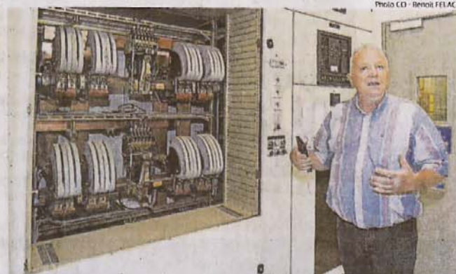
Dans les secrets de l'échange de données informatisées.